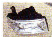
ライトユニット補修