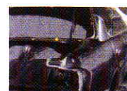
パネル接着・補修