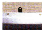
ブラケットの取り付け