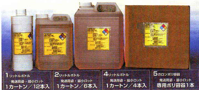
1リットルボトル 発送荷姿・最小ロット 1カートン/12本入 2リットルボトル 発送荷姿・最小ロット 1カートン/6本入 4リットルボトル 発送荷姿・最小ロット 1カートン/4本入 5リットルボトル 専用ポリ容器 1本